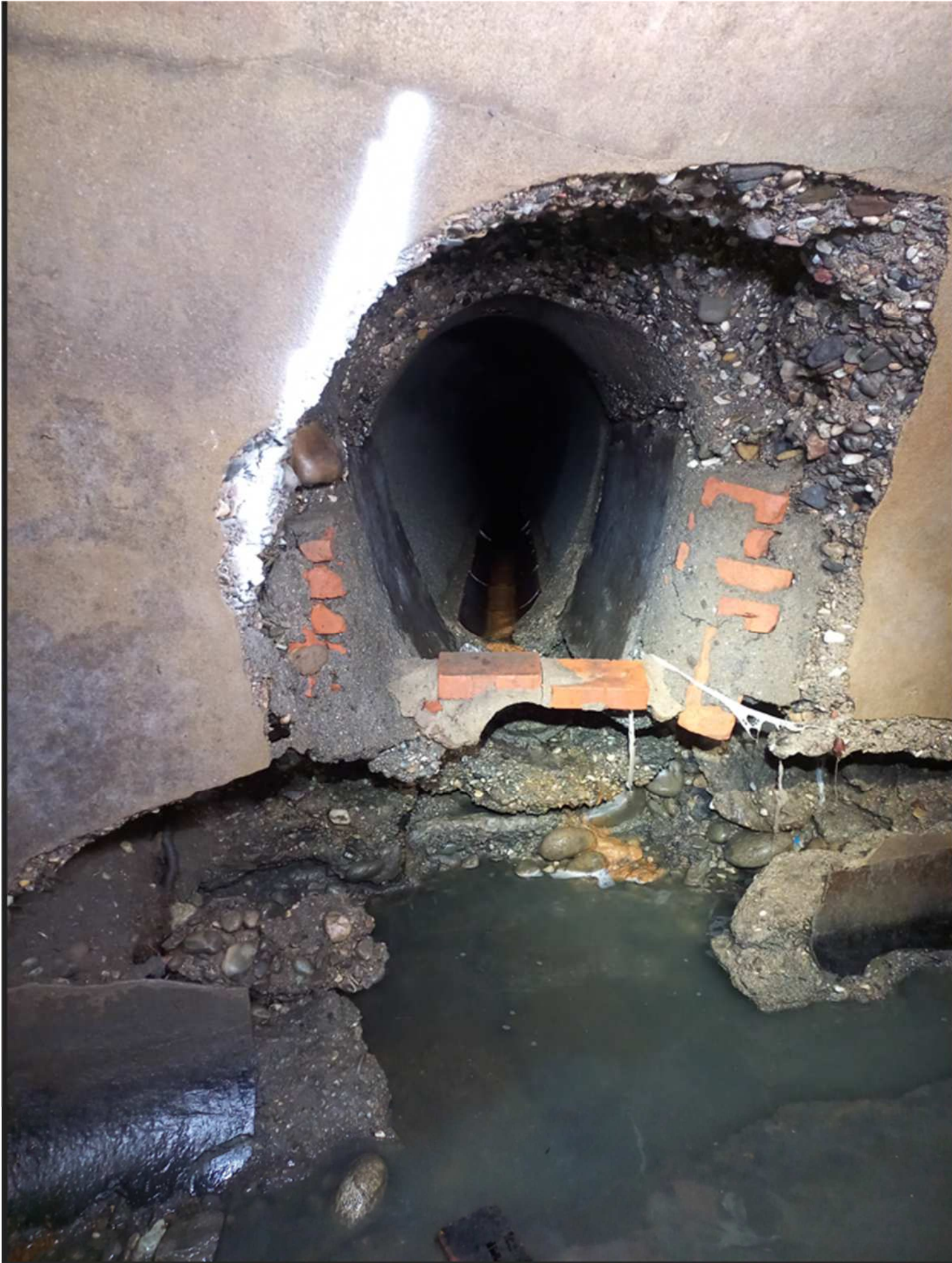
STATO DI FATTO ANTE LAVORI: CAVITA' - EROSIONE DEL PIEDRITTO